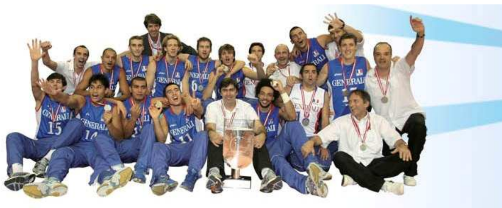
L'équipe de France vice-championne d'Europe 2009

Contact presse FFVB : Hubert Guériaux – 06 09 76 43 99