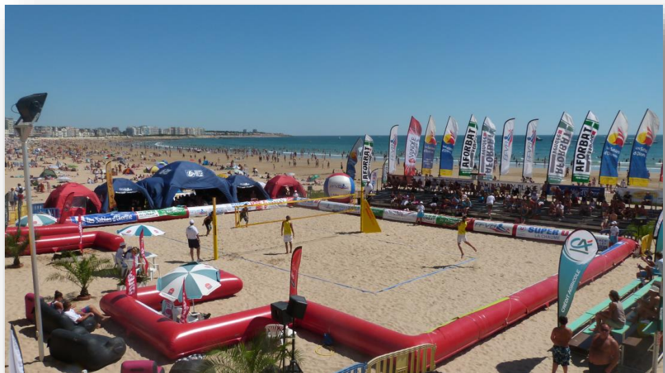
Terrain central du Tournoi des Sables d'Olonnes – Championnat de France 2012

repas équilibrés pour sportifs (insister sur les féculents). Entrée + Plat principal (copieux) + Dessert (+ fromage ou salade)